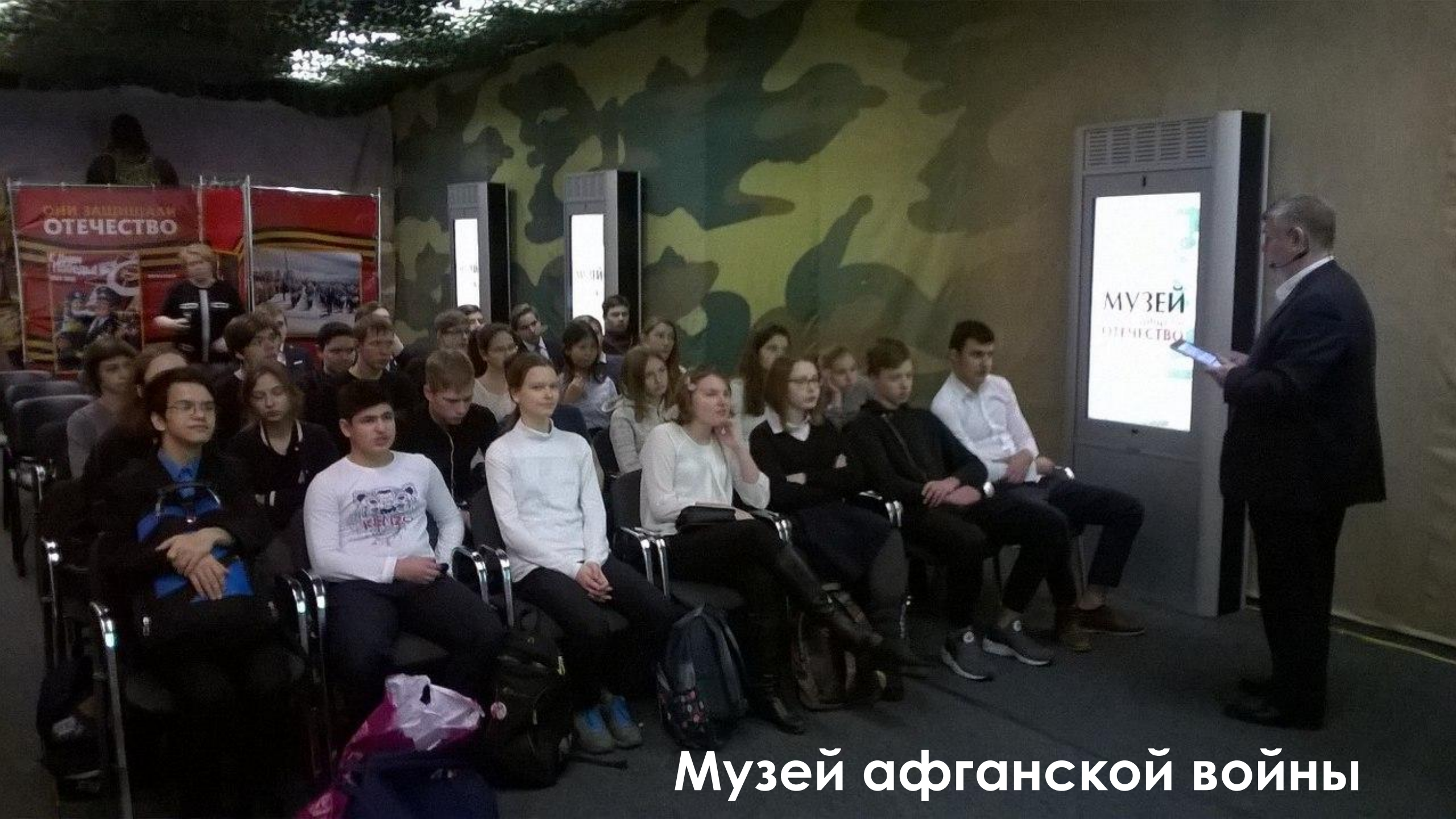
Музей афганской войны