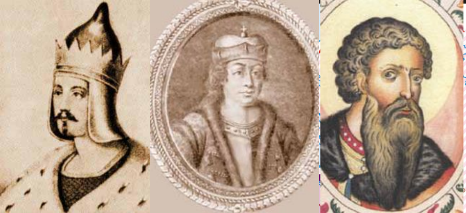
Русь в XI в. (1015–1113 гг.)

Еще при жизни Ярослав Мудрый разделил земли между своими сы- новьями: