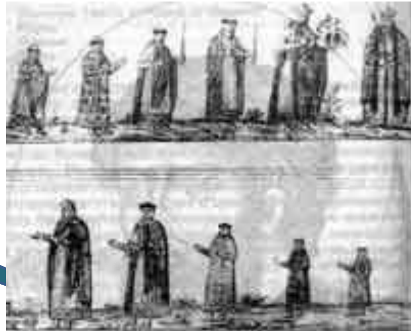
Семья Ярослава (фреска Софийского собора)

Всеволод – Чернигов, бывшая отчина Святослава