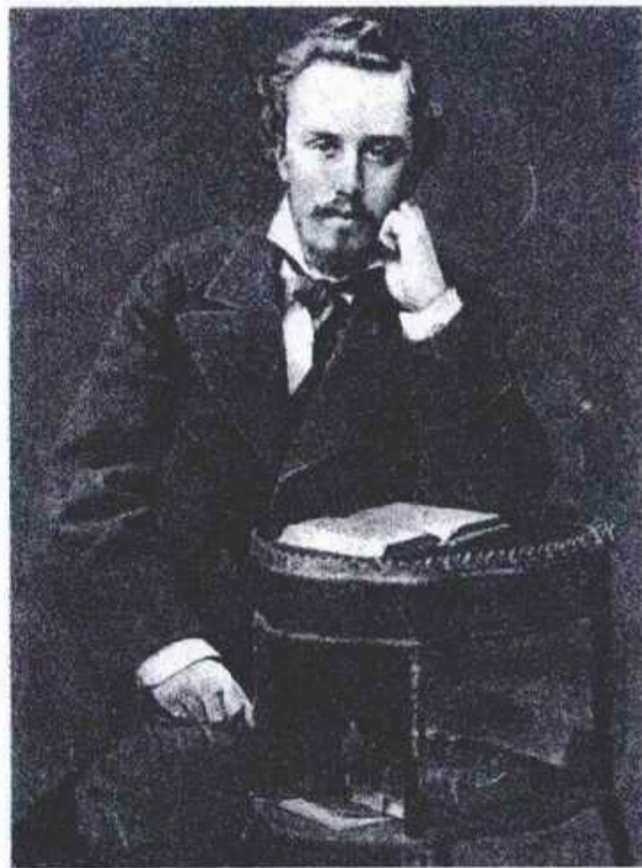
А.Л. БЛОК (отец поэта).