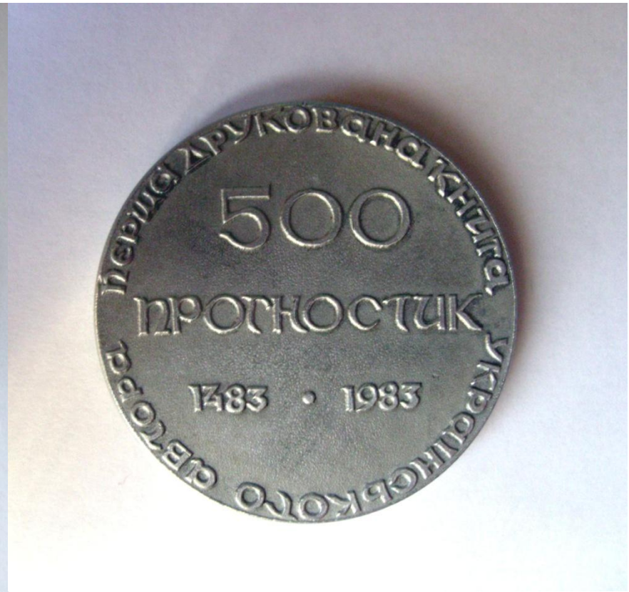
Зворотний бік пам'ятної медалі , випущеної до 500-ліття "Прогностичної оцінки поточного 1483 року Ю. Дрогобича.