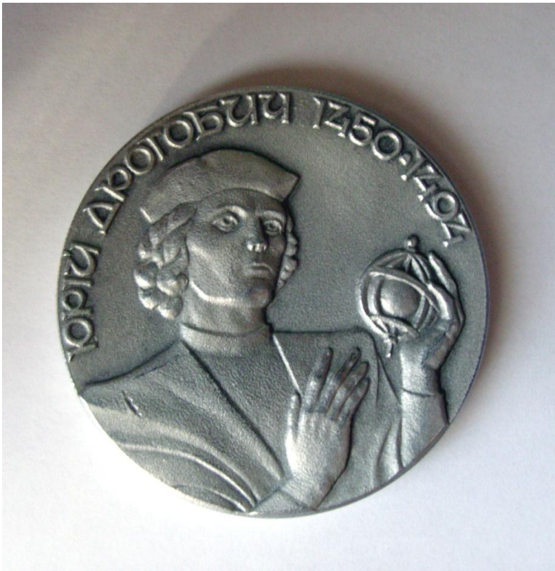
Лицевий бік пам'ятної медалі , випущеної до 500-ліття "Прогностичної оцінки поточного 1483 року Ю. Дрогобича