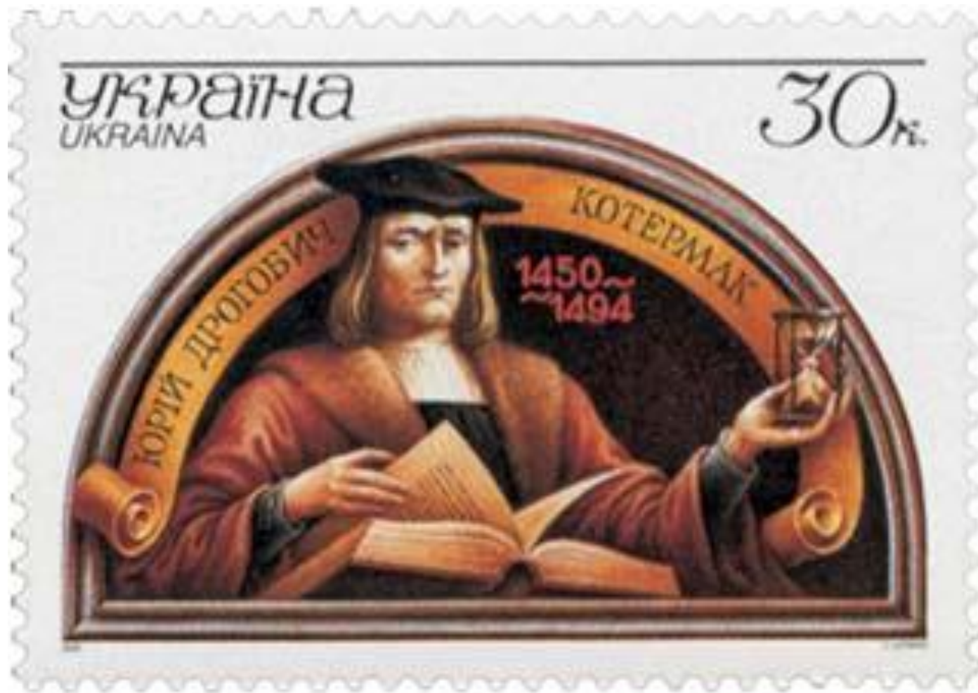
Юрій Котермак на українській поштовій марці