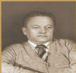
ІВАН ШАМЯКІН: вядомы і невядомы

Шамякіна. - Мінск : Літаратура і Мастацтва, 2011. - 270 с.