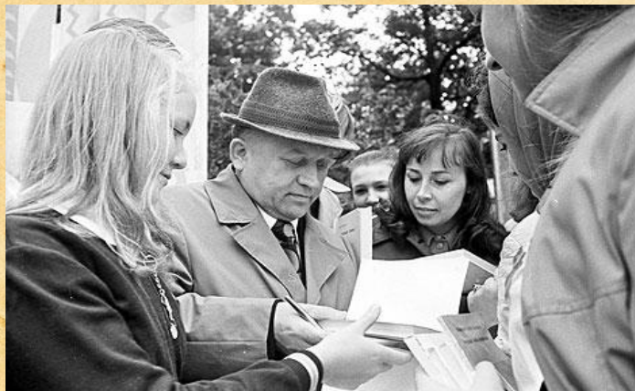
Іван Шамякін на свяце паэзіі дае аўтографы