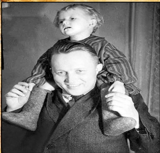
З дачкой Таццянай