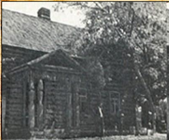
Дом, дзе жыў пісьменнік