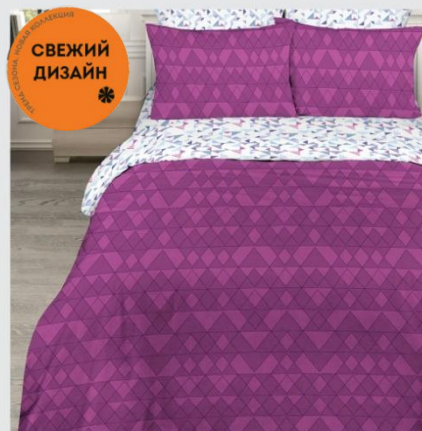
7000 «Кристалл», вид 1