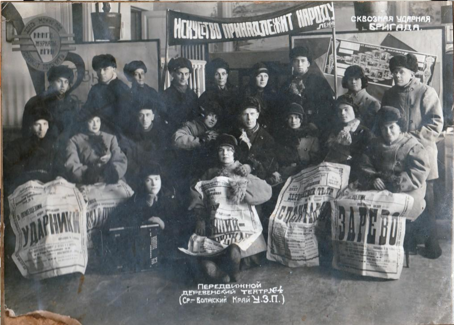
ПЕРЕДВИЖНОЙ ДЕРЕВЕНСКИЙ ТЕАТР № 4 (Ср.-Волжский Край У.З.П.)