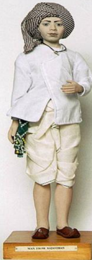
MAN FROM RAJASTHAN