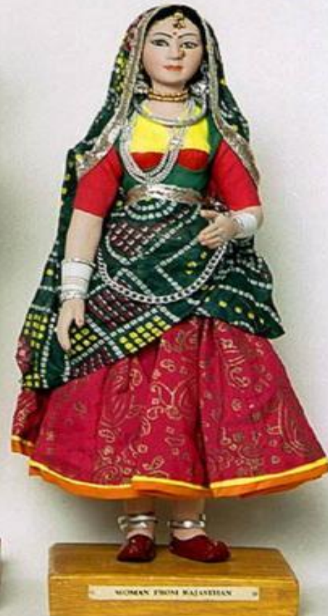
WOMAN FROM RAJASTHAN