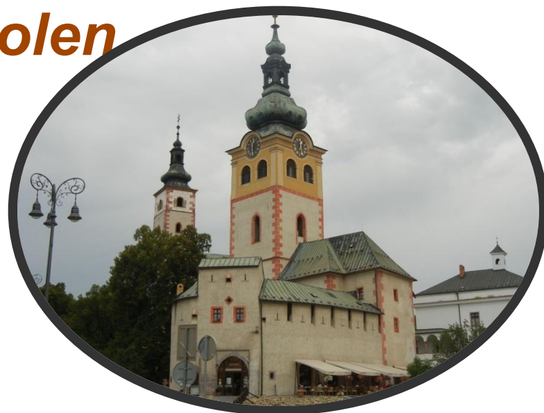
Mestský hrad v Banskej Bystrici