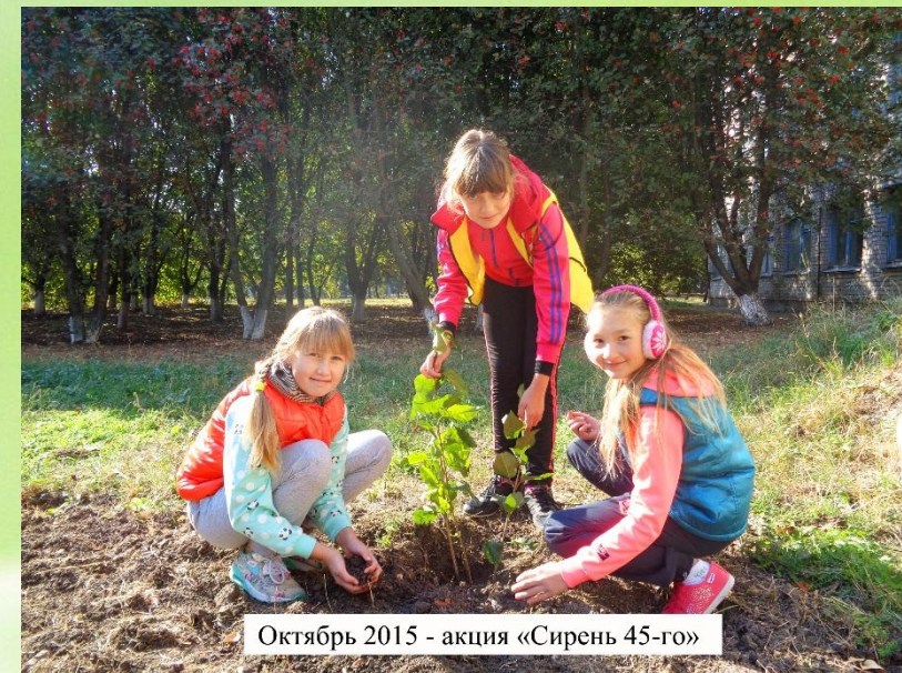
Октябрь 2015 - акция «Сирень 45-го»