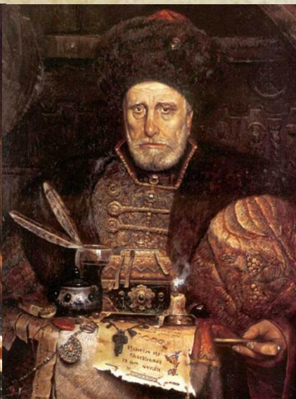
Князь Андрей Курбский