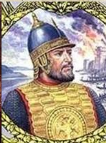
Дворянин Алексей Адашев