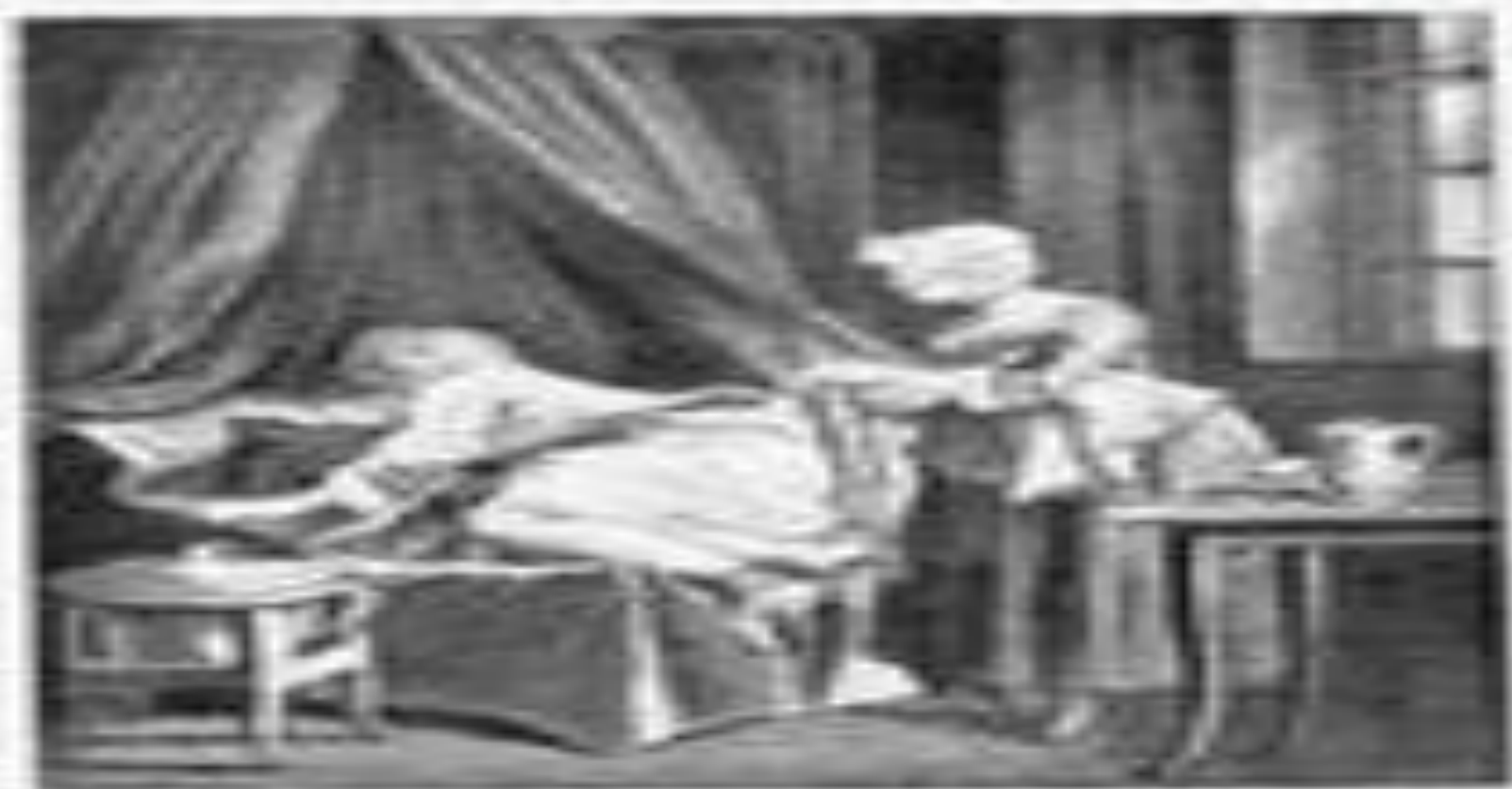
— There is a great deal of work to be done in the world. — J. N. T. 1851