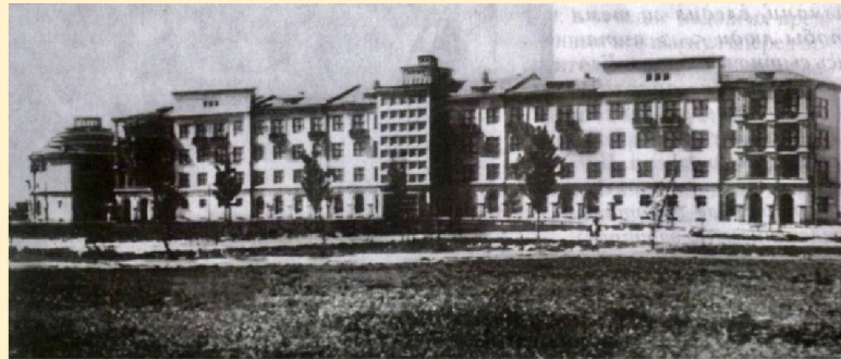
Терапевтический корпус областной больницы 1940 г. (Ротонда слева)

На первом этаже — вестибюль с фонтаном по центру, на втором этаже — демонстративный зал хирургического корпуса, где проводились занятия со студентами-медиками.