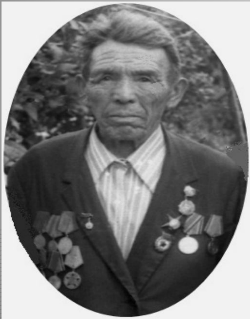
Орден Красной Звезды