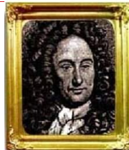
Готфрид Вильгельм Лейбниц