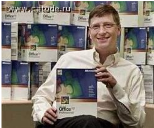
Билл Гейтс (1955 жыл)