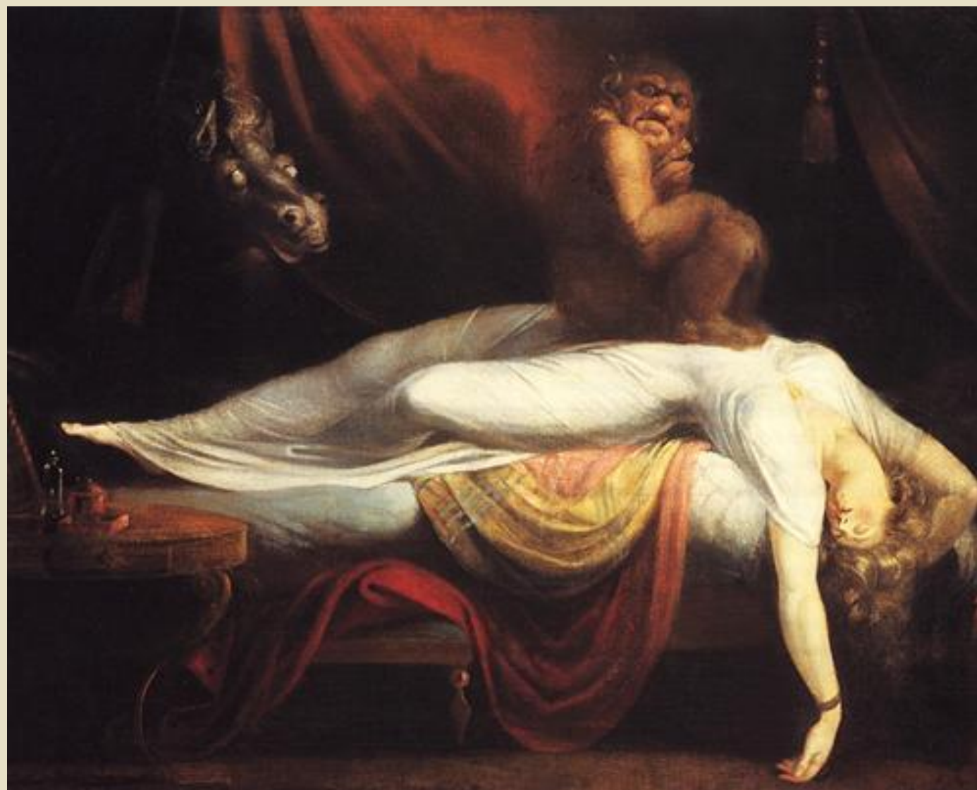
◦ В Англии: И. Фюсли «Ночной кошмар»