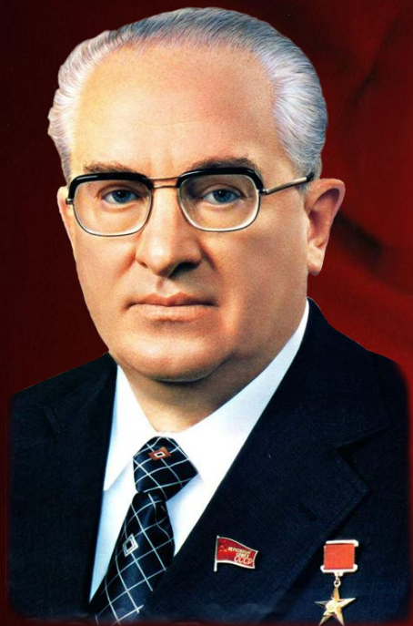
Юрий Владимирович Андропов