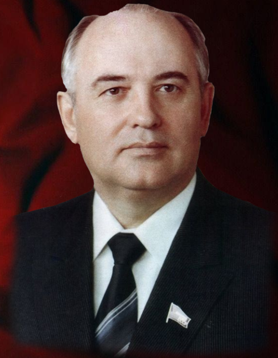
Михаил Сергеевич Горбачёв