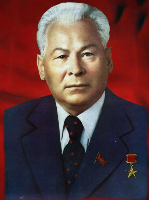
Константин Устинович Черненко