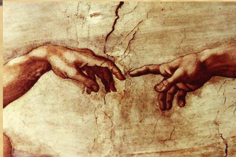
Сикстинская капелла. Ватикан. Фреска (1508 - 1512).