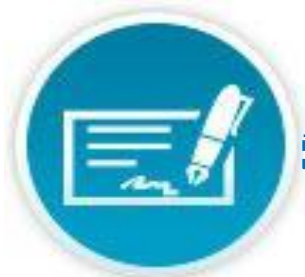
Схема нашей работы

Вы оставляете бесплатную заявку на сайте или договариваетесь с менеджером