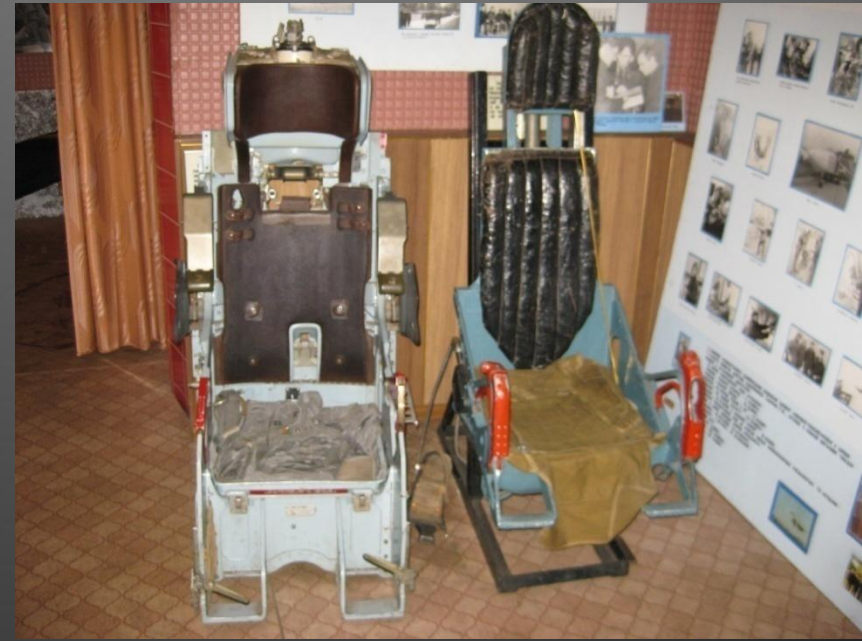
Сидения летчика и штурмана на самолете Су-24м