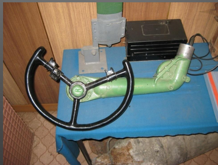
Руль самолета Як-17