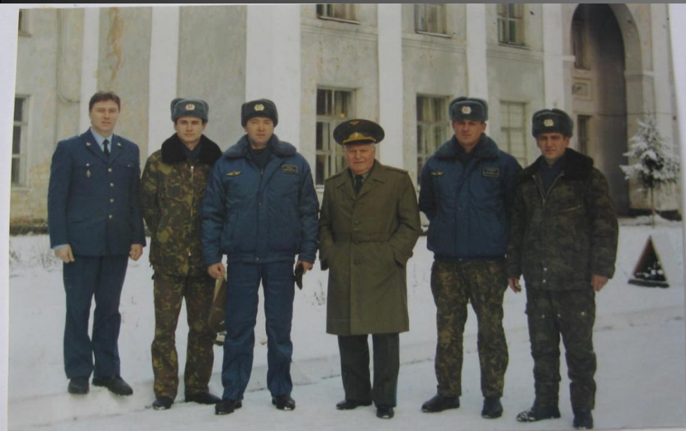
ЛЕТЧИК-КОСМОНАВТ ТИТОВ Г.С. В СИВЕРСКОЙ