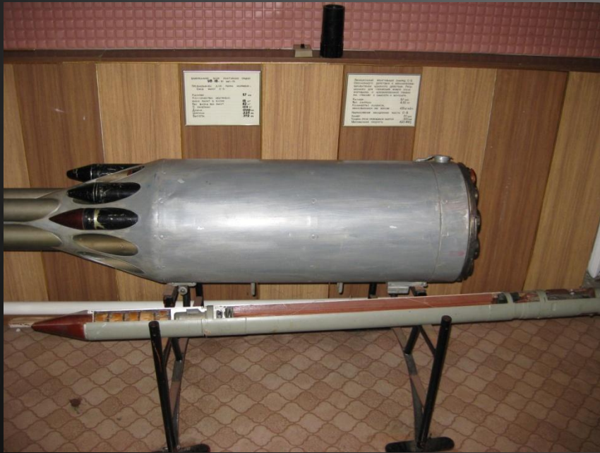
Универсальный блок реактивных орудий УБ-16-57 предназначен для выпуска неуправляемых ракет С-5