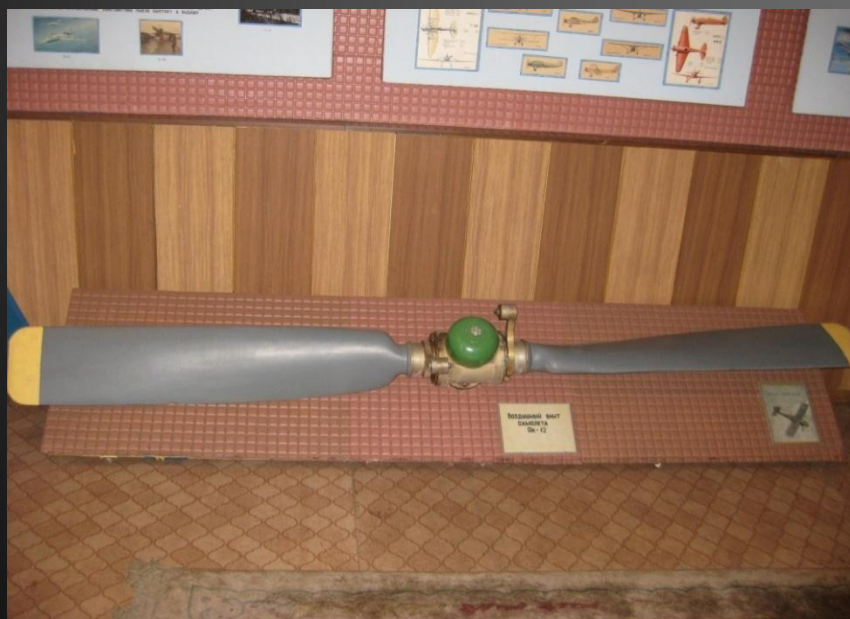
Винт самолета Як-17