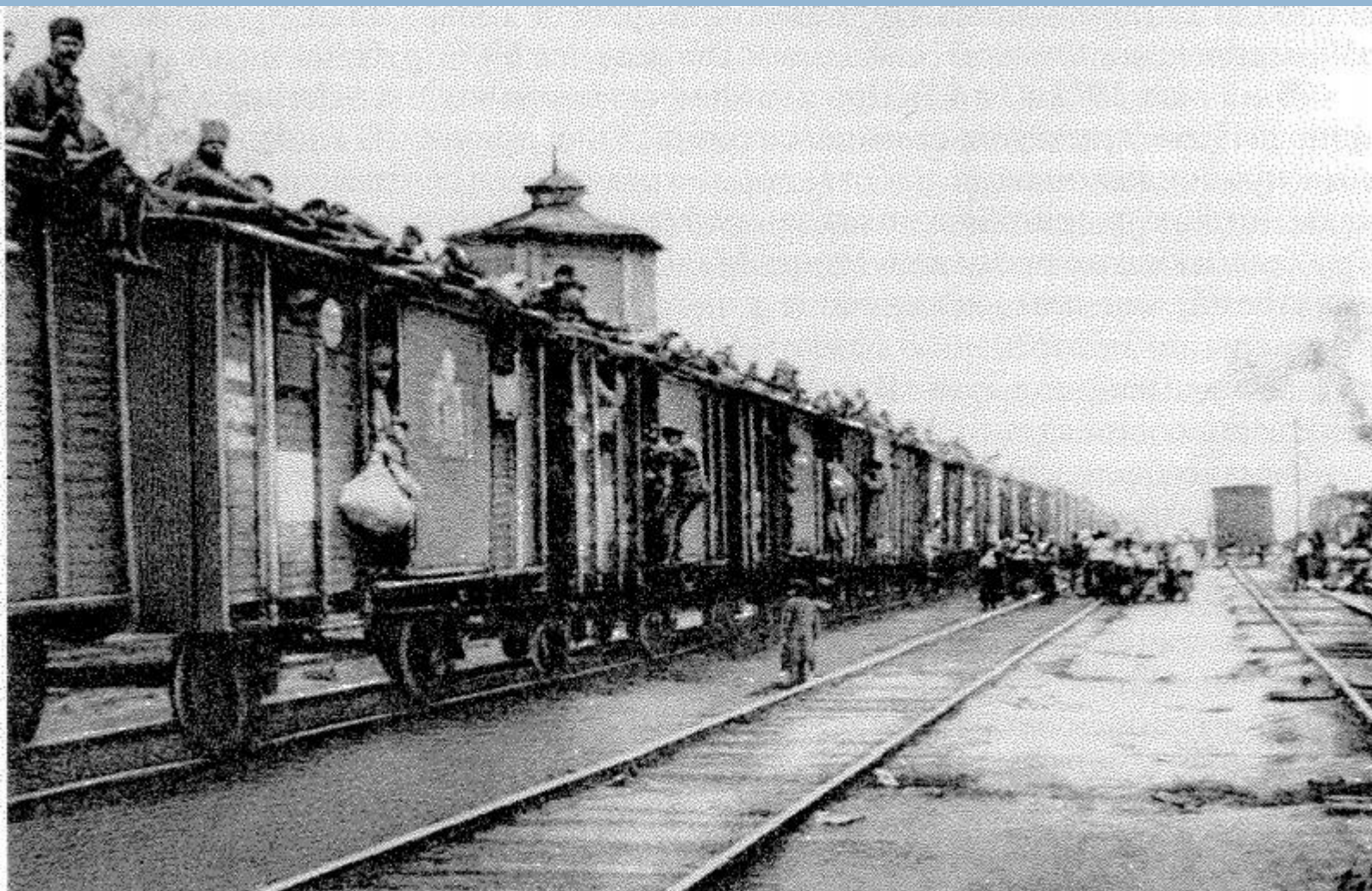
Состав с мешочниками во время разрухи и голода.