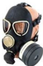
Противогаз гражданский фильтрующий ГП-7