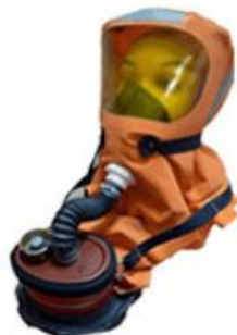
Самоспасатель, изолирующий СПИ-20