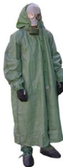
Общевойсковой защитный комплект ОЗК