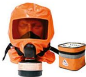
Газодымозащитный комплект ГДЗК-А