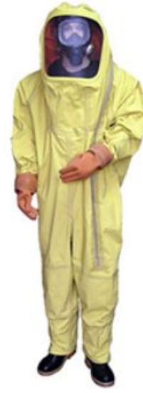
Костюм изолирующий КИХ-5