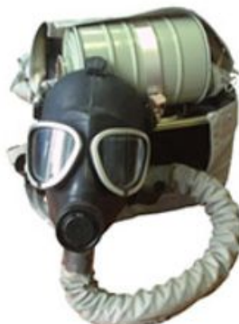
Противогаз изолирующий ИП-4М