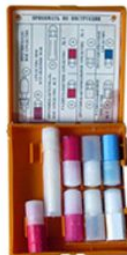
Аптечка индивидуальная АИ-2

АИ-2 предназначена для предупреждения или снижения действия различных поражающих факторов, а также для профилактики развития шока при травматических повреждениях.