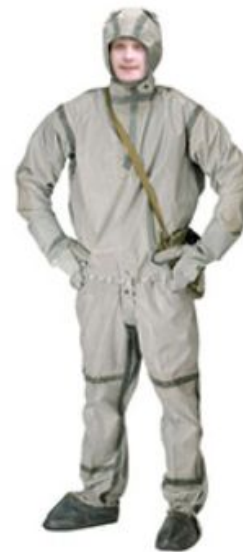
Легкий защитный костюм Л-1