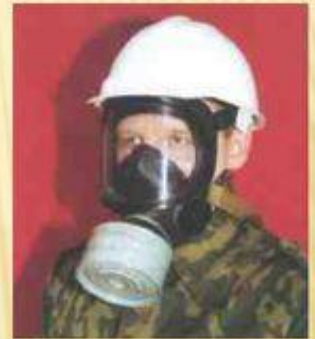
Современный фильтрующий противогаз