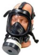
Промышленный фильтрующий противогаз ППФ-1