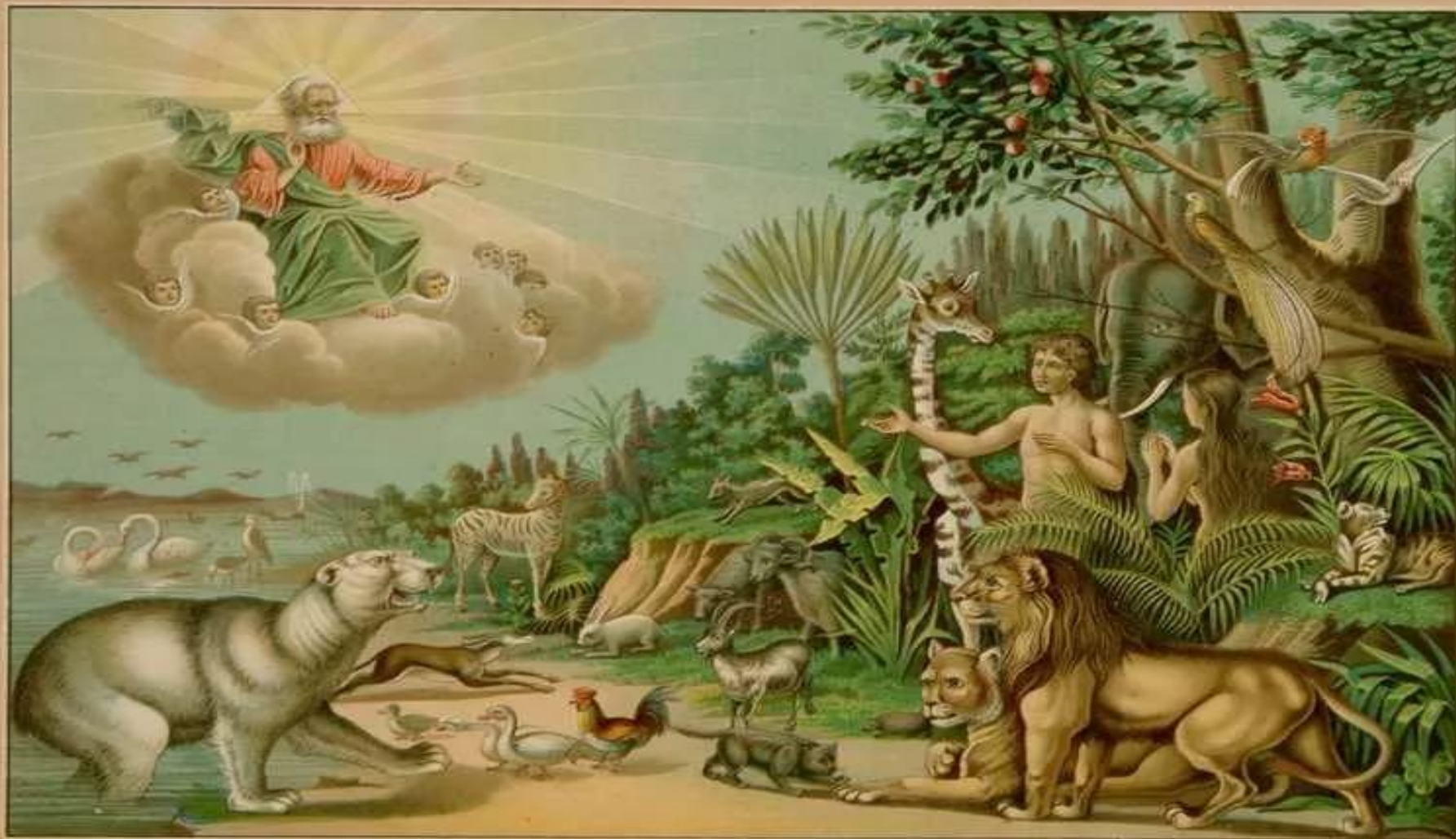
ПЕРВЫЕ ЧЕЛОВѢКИ ВЪ РАЮ АДАМЪ И ЕВА.

Среди животных не было вражды: сильные не трогали слабых, все жили вместе и питались травой и растениями. Никто из них не боялся людей, и все любили и слушались их. Но высшее счастье Адама и Евы состояло в общении с Богом. Господь являлся им в раю видимым образом, как отец детям, и беседовал с ними.