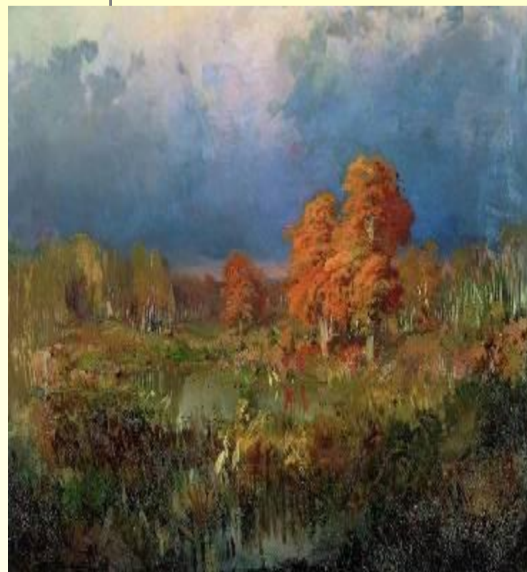
Болото в лесу. Осень