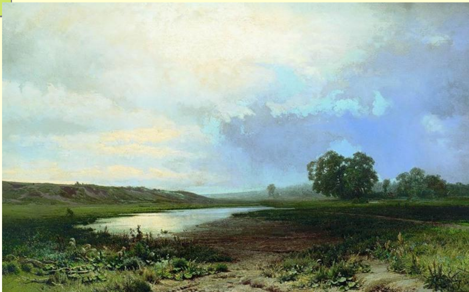
Ф. Васильев «Мокрый луг»