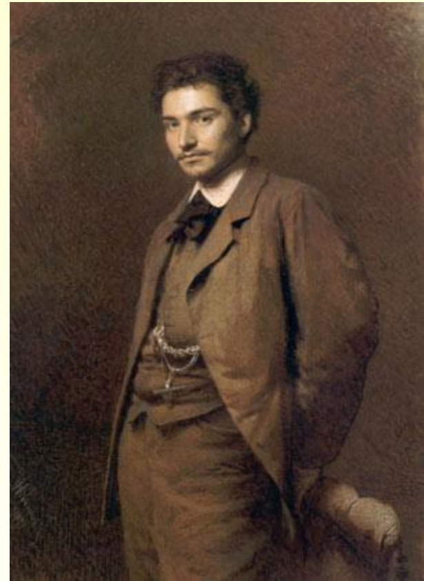
И.Н.Крамской. Портрет художника Ф.А.Васильева