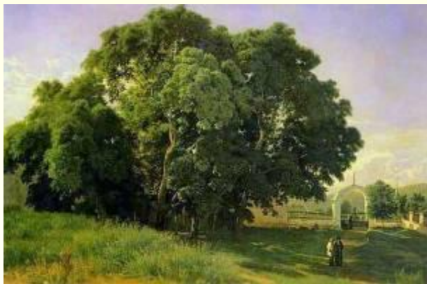
В церковной ограде. Старое кладбище Валаамского монастыря.