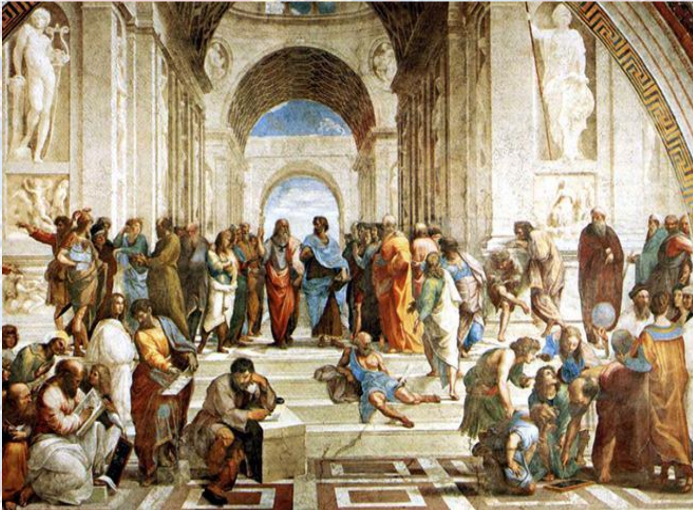
Рафаэль. Афинская школа (1511 г.)