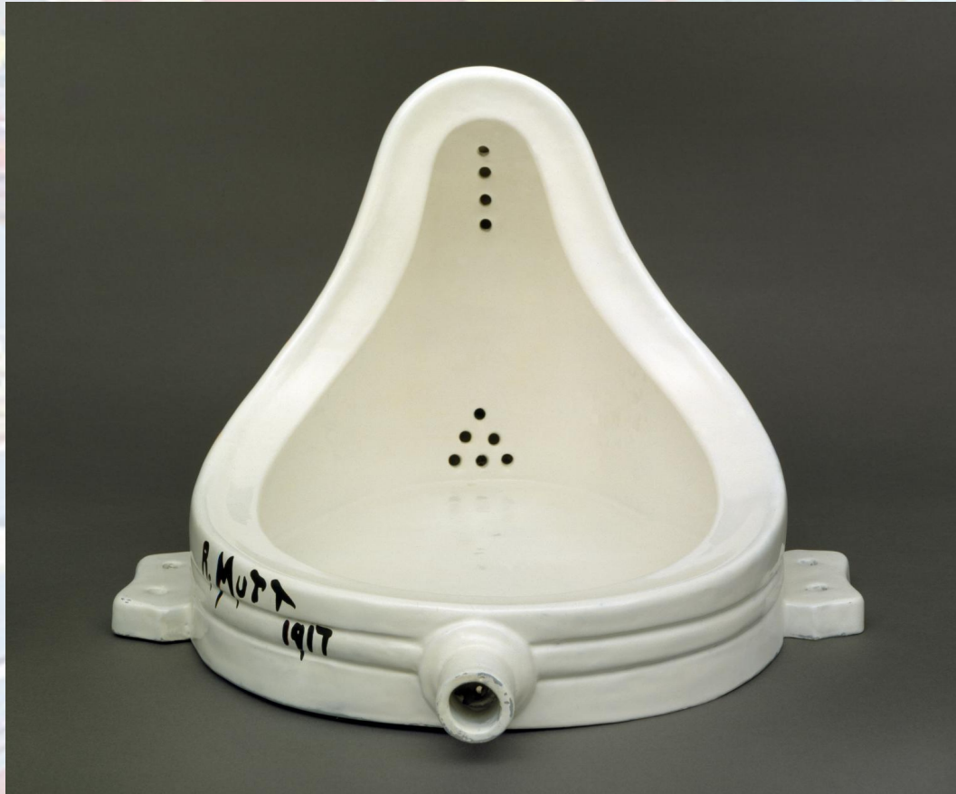
Марсель Дюшан. Фонтан (1917 год)