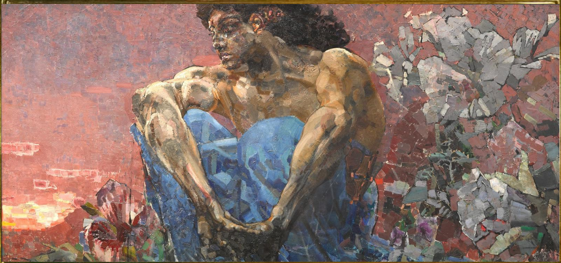
М. А. Врубель. Демон сидящий.

STELLUNG KÜNSTLER ÖSTERREICHS ERÖFFNUNG ENDE MÄRZ SCHLUSS MITTE JUNI GARTENBAU K. K. GARTENBAU GESELLSCHAFT 12. JUNI 1900 K. K. GARTENBAU GESELLSCHAFT