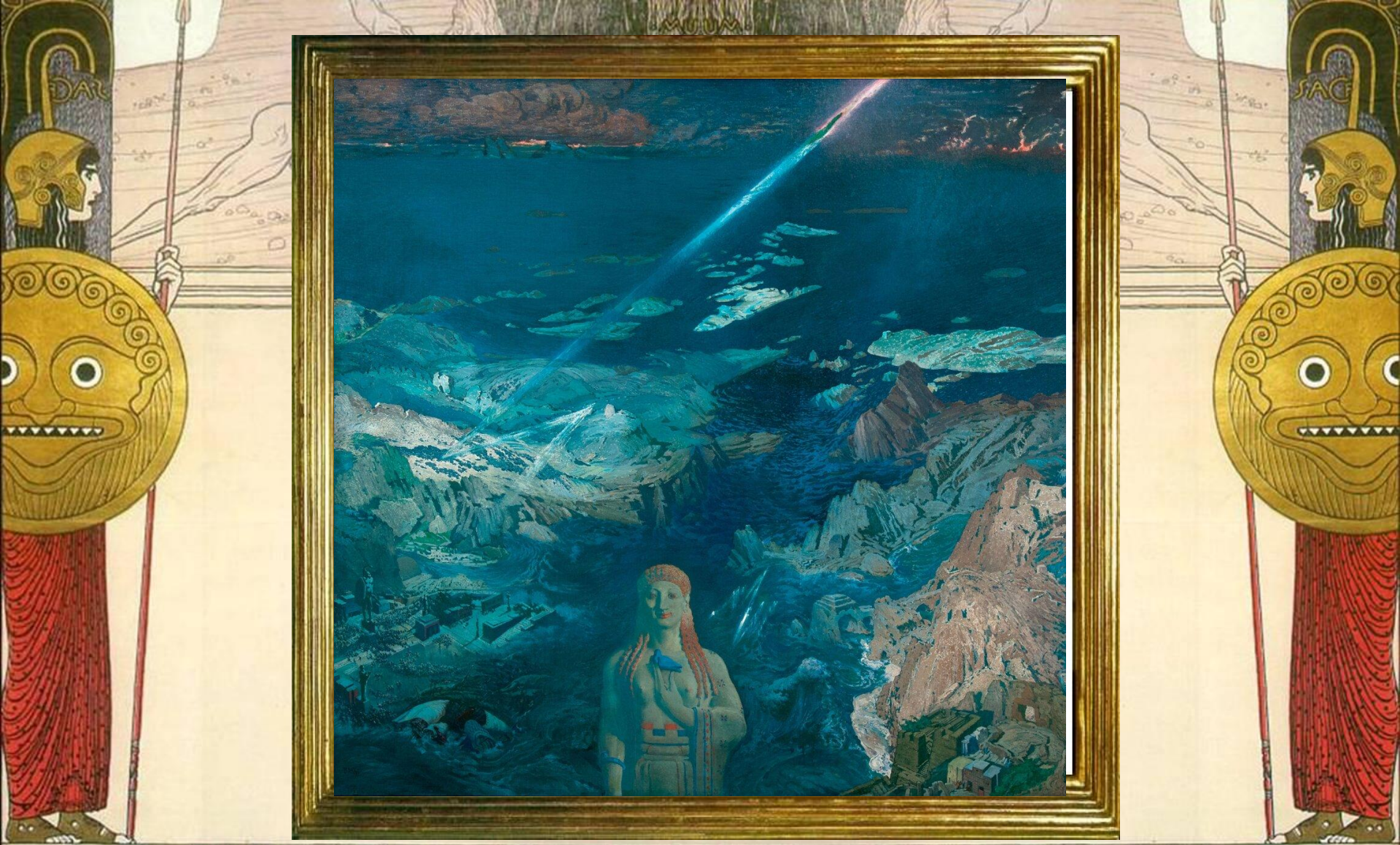
Л. С. Бакст. Древний ужас. 1908. Государственный Русский музей.

STELLUNG KÜNSTLER ÖSTERREICHS ERÖFFNUNG ENDE MÄRZ SCHLUSS: MITTE JUNI GARTENBAU K. K. ENDAUDE DER K. K. GARTENBAU GESELLSCHAFT 12. JUNI 1908 MUSEUM