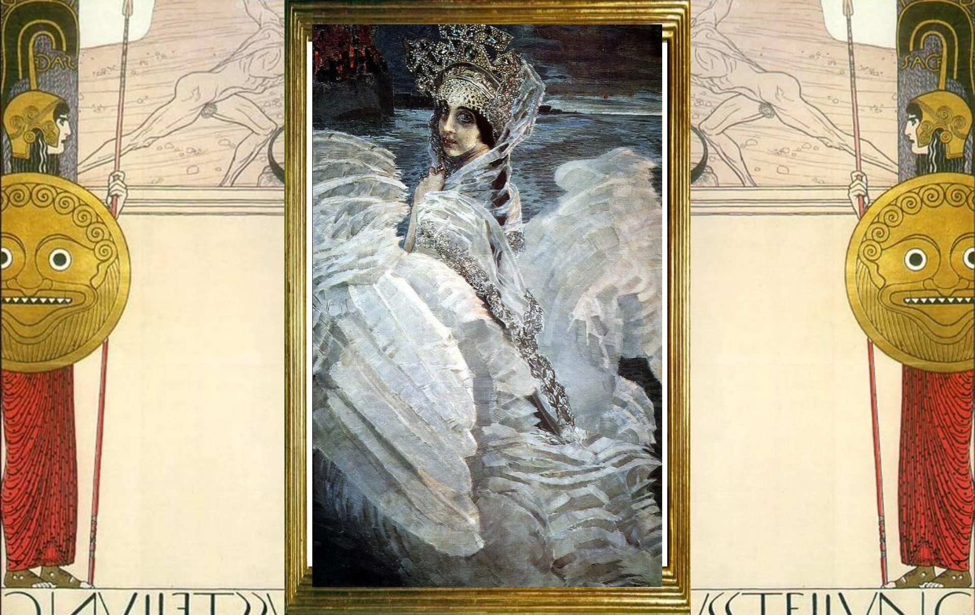
М. А. Врубель. Царевна-Лебедь. 1900. Государственная Третьяковская

STELLUNG KUNSTLER ÖSTERREICHS ERÖFFNUNG ENDE MÄRZ (SCHL) MITTE JUNI GESELLSCHAFT