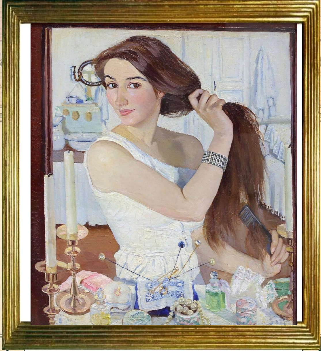
З. Е. Серебрякова. За туалетом. Автопортрет. 1909.