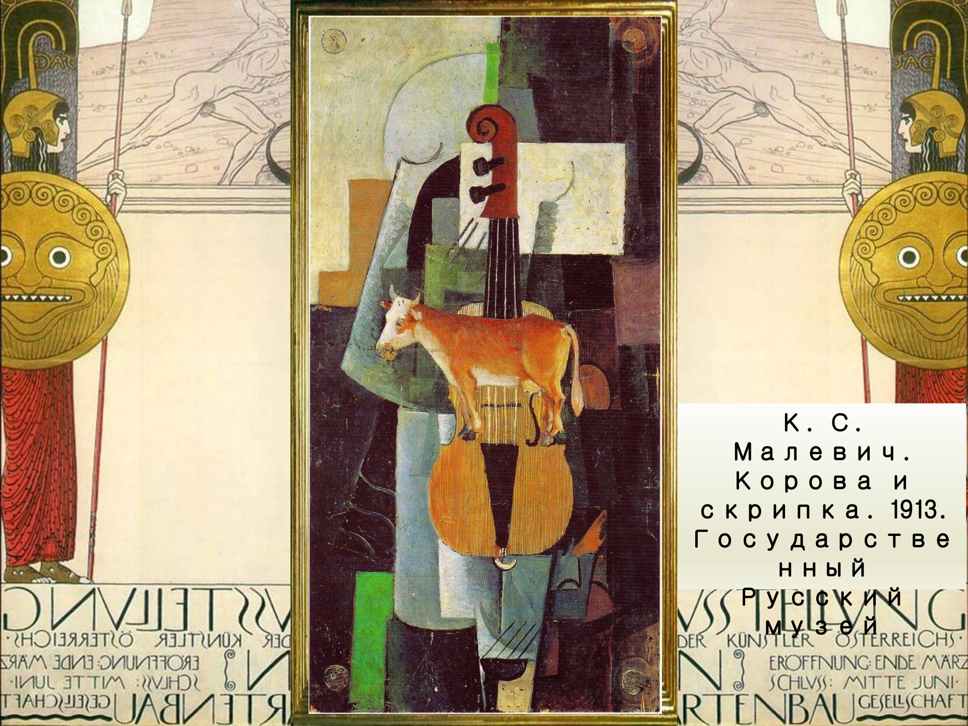
К. С. Малевич. Корова и скрипка. 1913. Государствен ный Русский музей

ARTENBAU GESSELLSCHAFT N ERÖFFNUNG: ENDE MÄRZ SCHLUS: MITTE JUNI N ERÖFFNUNG: ENDE MÄRZ SCHLUS: MITTE JUNI KUNSTLER ÖSTERREICH ARTSTELLVING