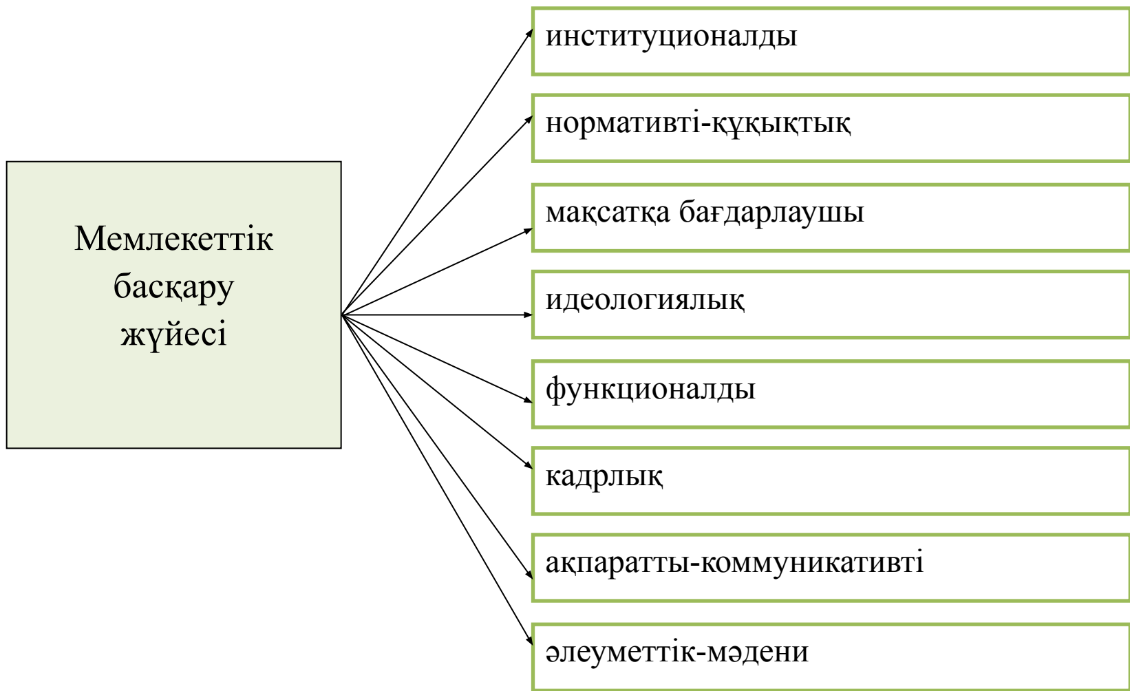
Сурет 1 - Мемлекеттік басқару жүйесінің құрылымы