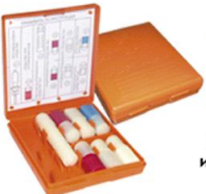
Аптечка индивидуальная АИ-2