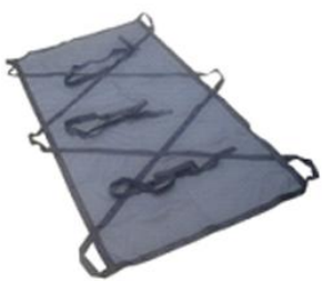
Носилки тканевые МС