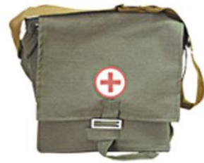
Сумка санитарная санинструктора сандружинника