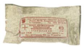
Пакет перевязочный индивидуальный ИПП-1