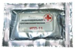
Пакет перевязочный индивидуальный ИПП-11