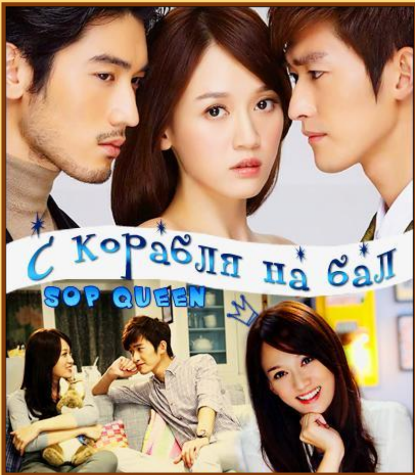
«С корабля на бал»

Д/з: выучить алфавит, все правила и слова в тетради, посмотреть серию дорамы (на выбор)