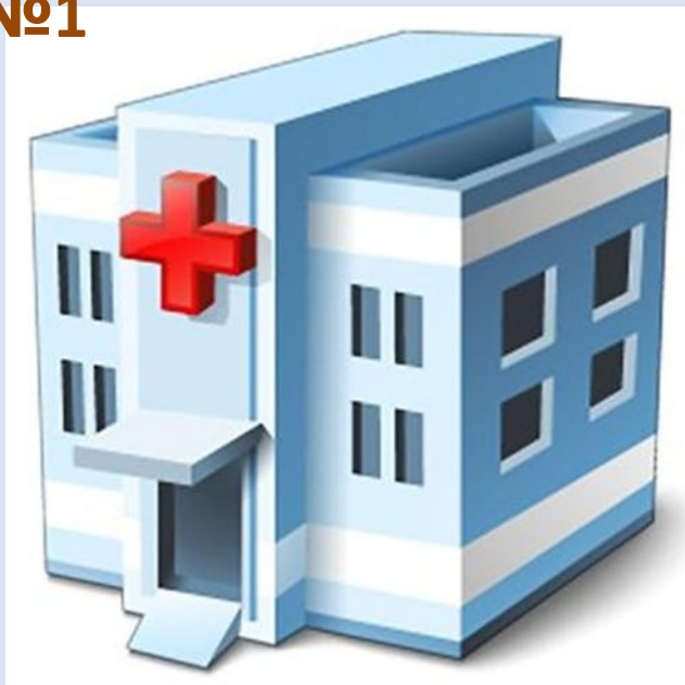
ДЕТСКАЯ БОЛЬНИЦА №1