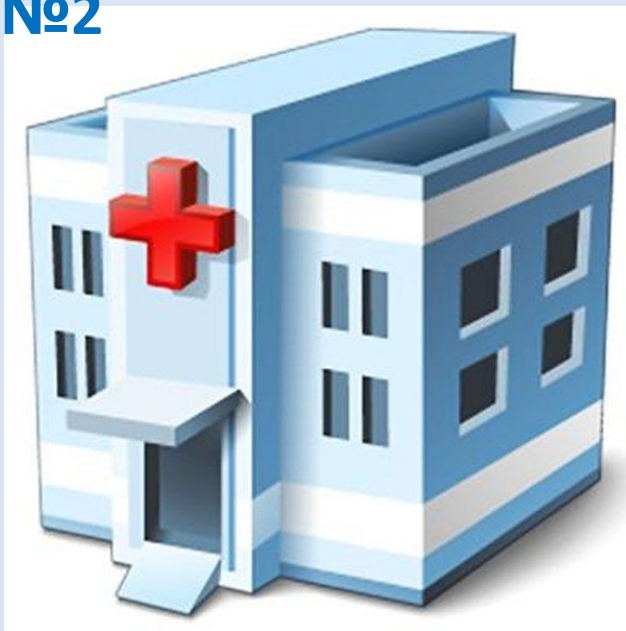
ДЕТСКАЯ БОЛЬНИЦА №2