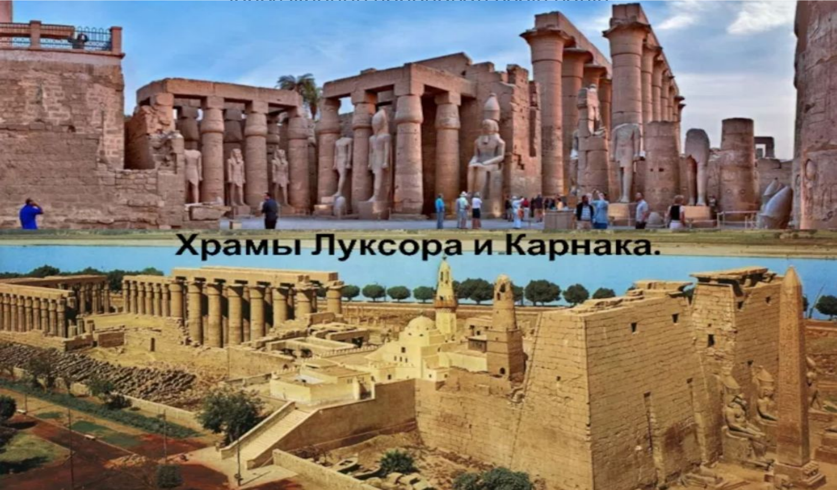
Храмы Луксора и Карнака.

В честь Бога возводились многочисленные храмы. В Луксоре и Карнаке остались части таких храмов, поражающих своим масштабом. Согласно проведенным археологическим исследованиям площадь храма в Карнаке могла составлять более 250 тыс. кв.км. Согласно египетским летописям из данного храма в «праздник долины» выносили Бога Амона Ра, который через жрецов передавал свою волю.