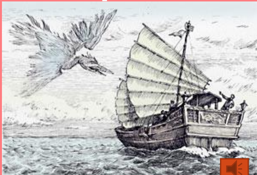
1 часть сюиты