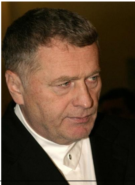
Владимир Вольфович Жириновский

Радикальная партия, выступающая за сильное государство, которому должны быть подчинены интересы всех его граждан.