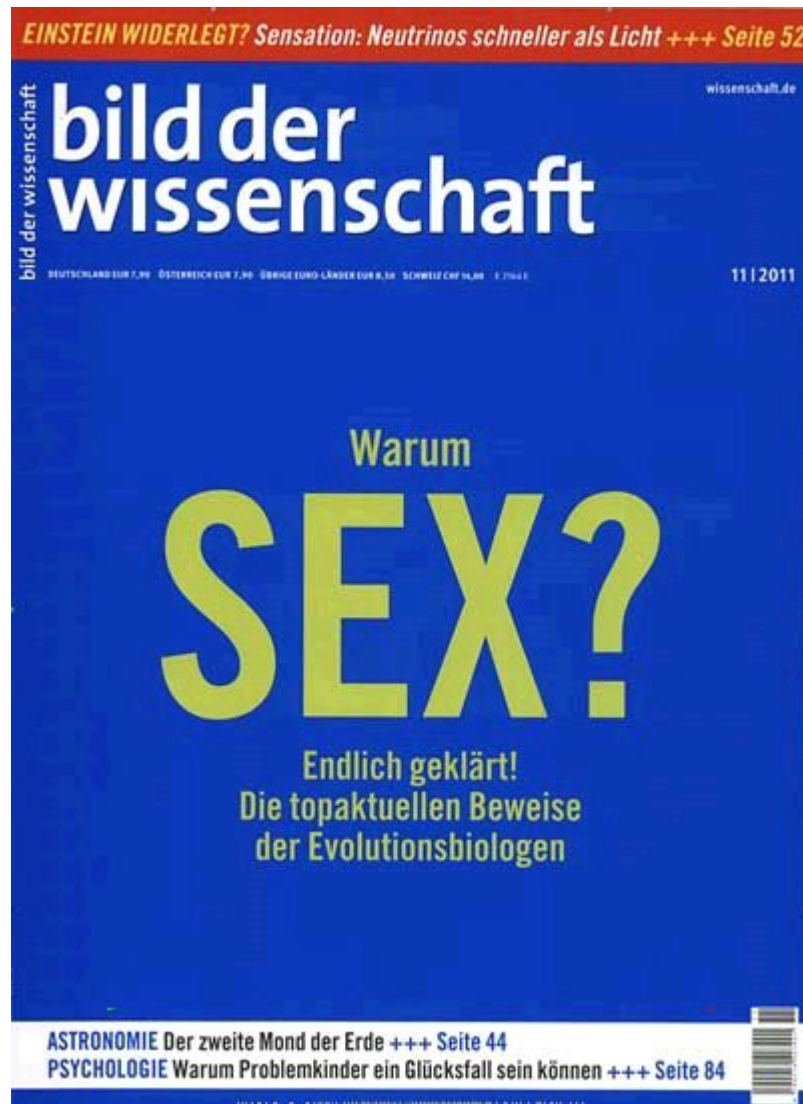
Bild der Wissenschaft