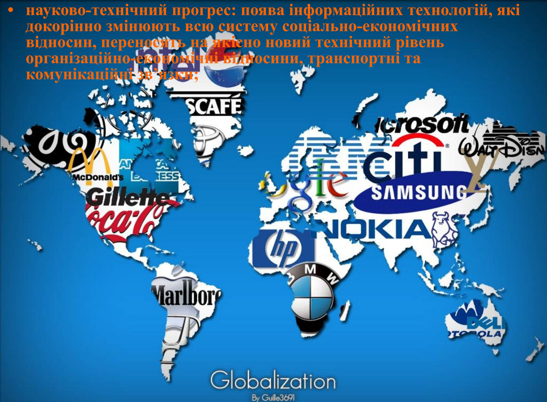
Globalization By Guille3691