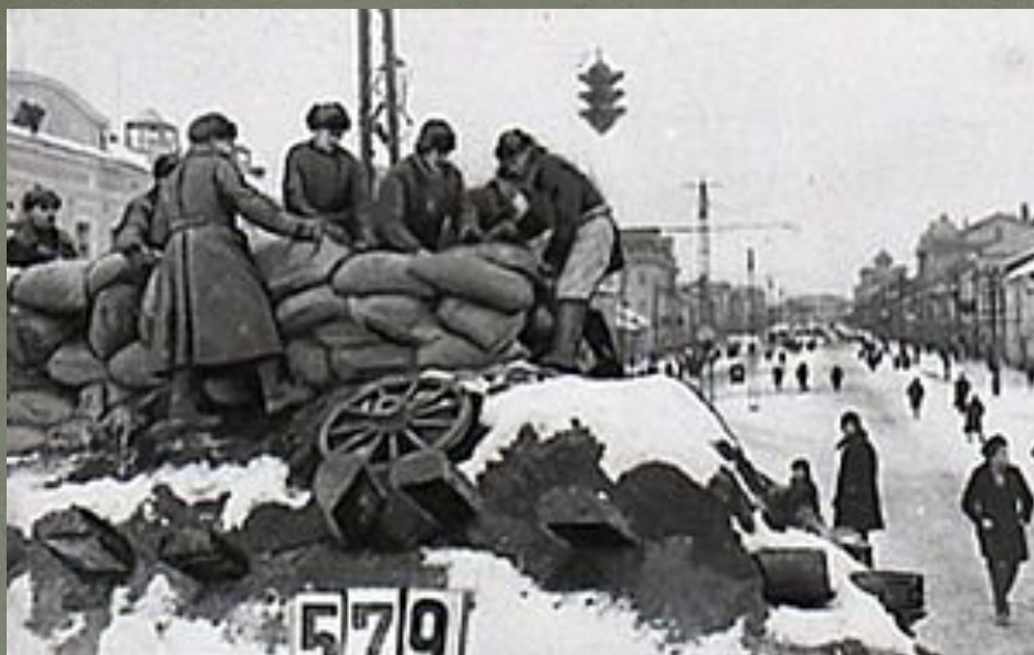
На рубежах обороны, 1941 год.

Защитники города готовы к бою. Тула, перекресток улиц Советской и Коммунаров (ныне проспект Ленина).