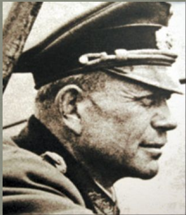
Гейнц Вильгельм Гудериан (1888-1954)

Фюрер Адольф Гитлер приказал Гудериану держаться до последнего, но генерал не послушал вождя и увел остатки армии из-под Тулы. Впоследствии за самовольство Гитлер отстранил Гудериана от командования танковой армией.