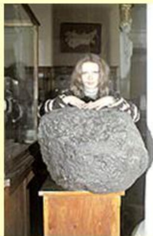
Метеорит «Палласово Железо» (гипсовый муляж)