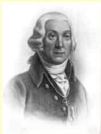
Академик П.С. Паллас