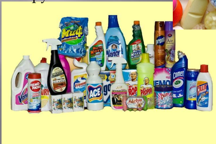
Хімічні речовини побуту