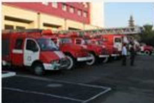
Өрт сөндіру депосы