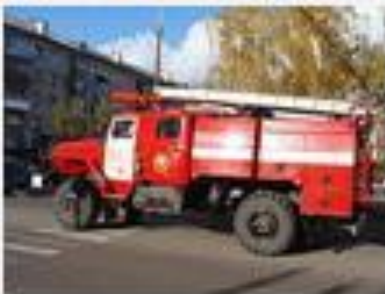
Өрт сөндіру автомобилі