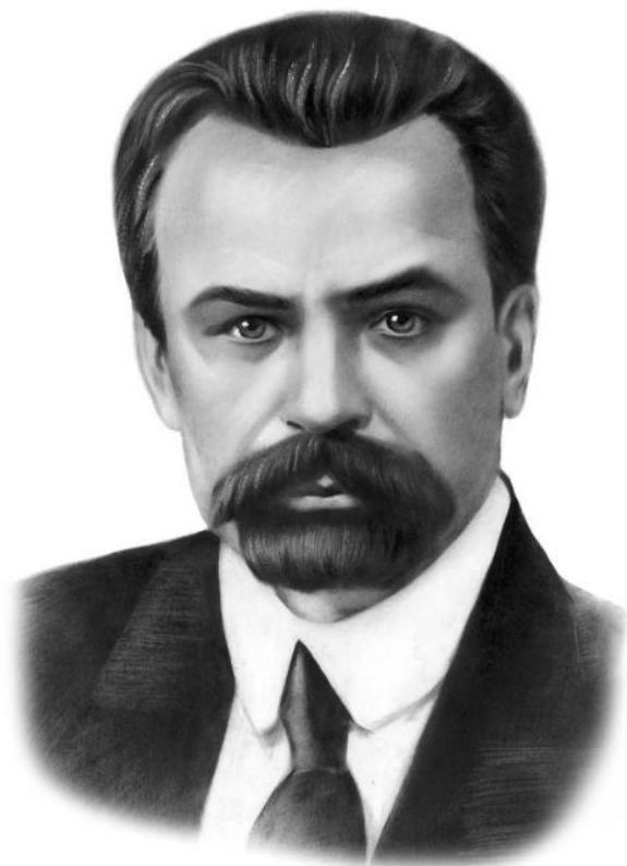
Володимир Винниченко (1880—1951)