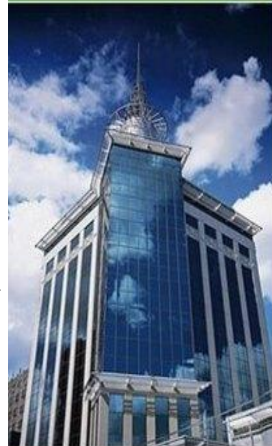
Головной офис БАНКА УРАЛСИБ Москва, ул.Ефремова, д .8