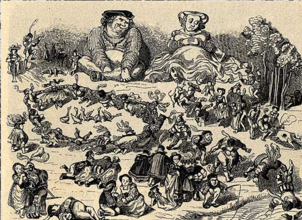
Гюстав Доре. Иллюстрации к роману, XIX век