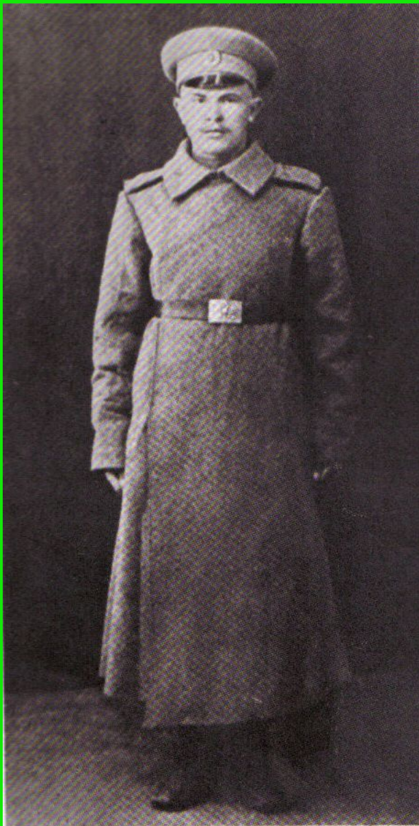
...І ў жніўні 1915 года мяне папрасілі пастаяць «за веру, цара і айчыну».