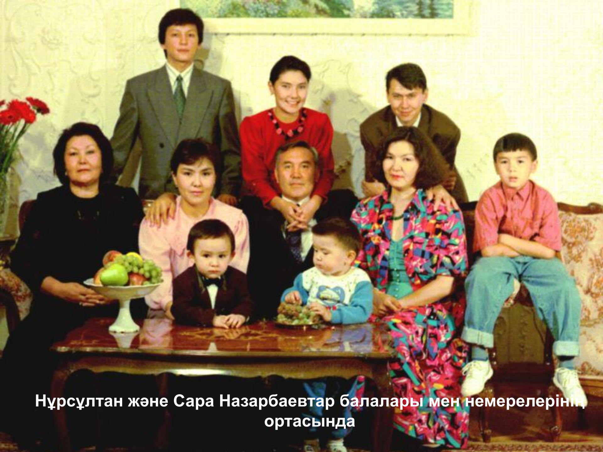
Нұрсұлтан және Сара Назарбаевтар балалары мен немерелерінің ортасында