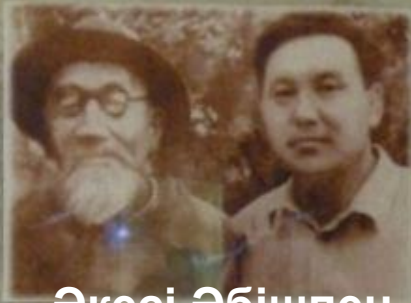
Әкесі Әбішпен бірге

1. Шығыс Қазақстан облысының, Қарағанды облысының және Семей облысының аумағындағы құрылымдарда және ұжымдарда қызмет еткендердің тізімі. Қарағанды облысының және Семей облысының аумағындағы құрылымдарда және ұжымдарда қызмет еткендердің тізімі. Қарағанды облысының және Семей облысының аумағындағы құрылымдарда және ұжымдарда қызмет еткендердің тізімі.