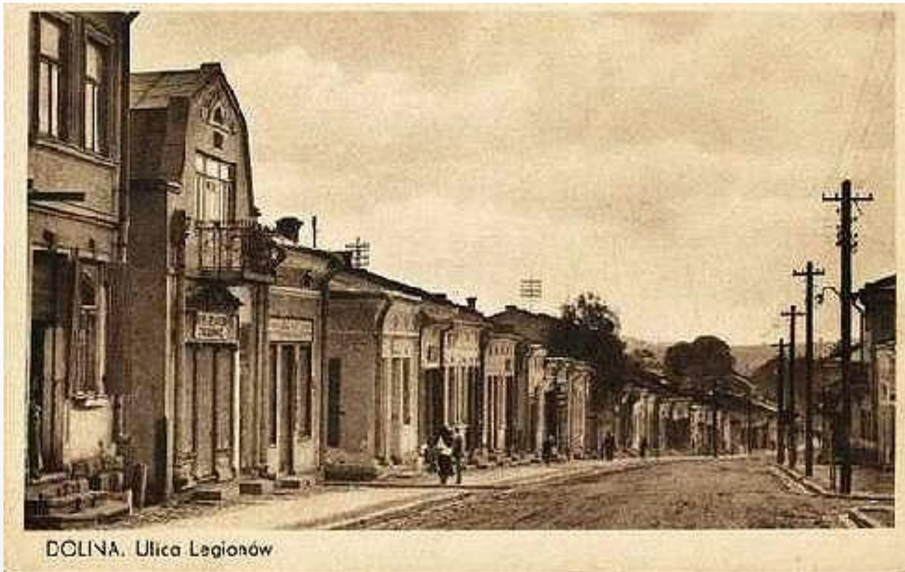
DOLINA. Ulica Legionów

Місто засновано в 979 році, коли було відкрито соляні джерела на цій території. У XV столітті тут панували поляки. Повна назва міста була — «Вільне королівське місто Долина».