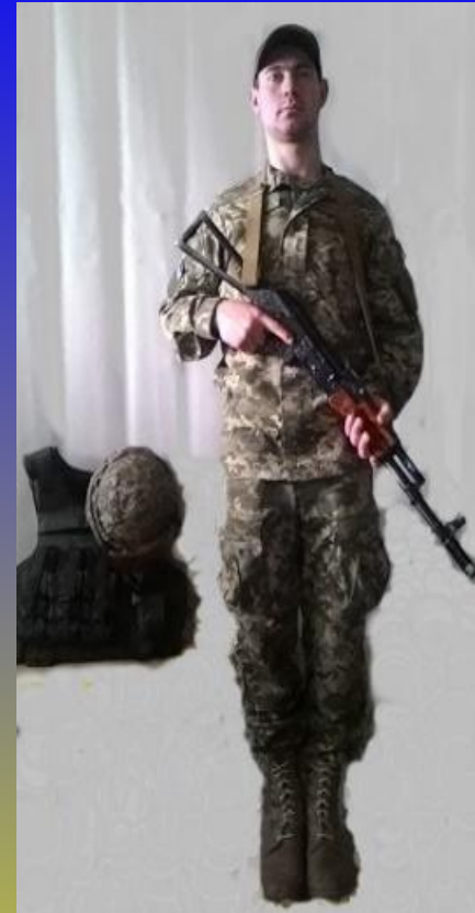
СТУПІНЬ ЗАХИСТУ «Ф2»

ШОЛОМ БАЛІСТИЧНИЙ ТА БРОНИЖИЛЕТ НА ВІЙСЬКОВОСЛУЖБОВЦІ