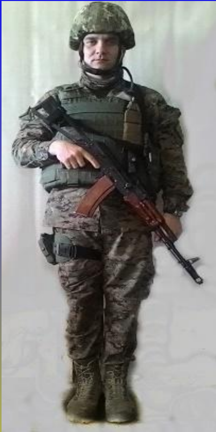
СТУПІНЬ ЗАХИСТУ «Ф1»

ШОЛОМ БАЛІСТИЧНИЙ ТА БРОНИЖИЛЕТ НА ВІЙСЬКОВОСЛУЖБОВЦІ