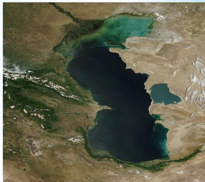
, Каспий маңы ойпатының солтүстік жартысы,