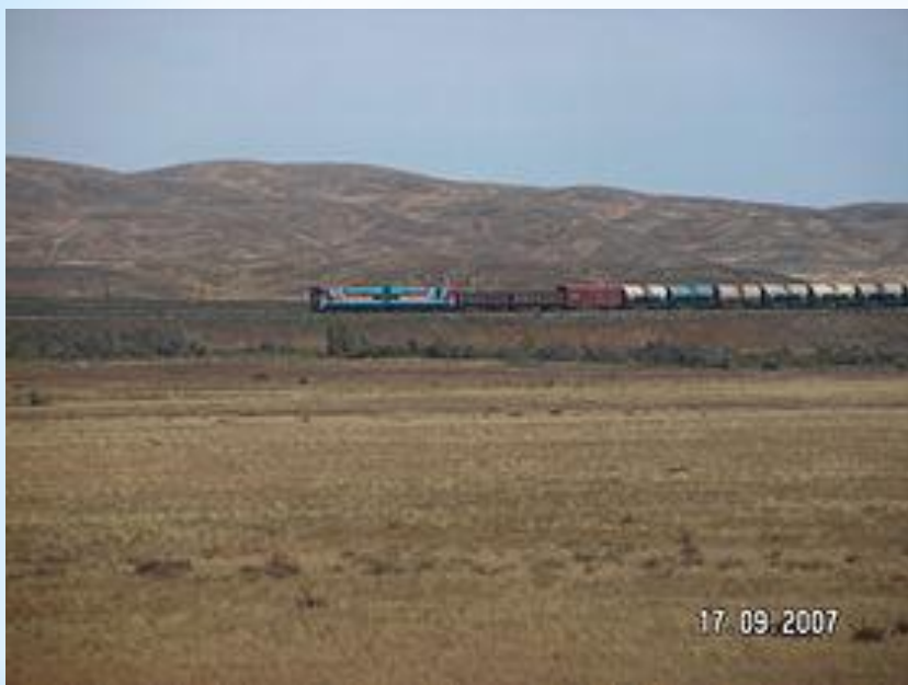
Мұғалжар тауы түгелдей дерлік