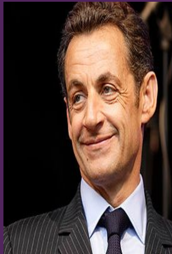
Князь Николя Саркози