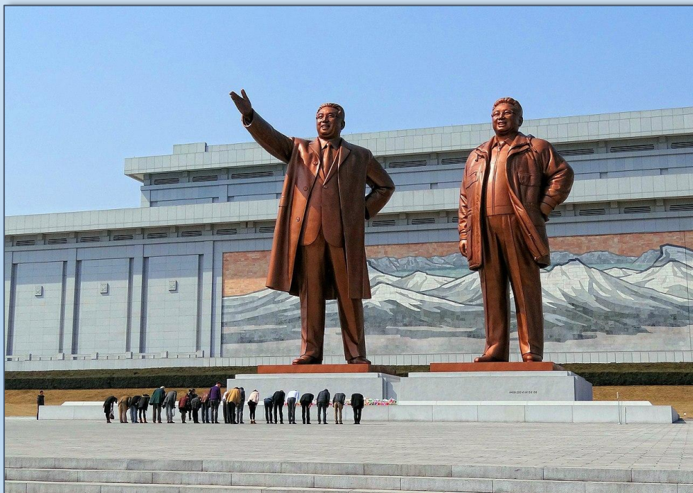
- пам'ятник вождям КНДР

Формально Північна Корея вважається однопартійною республікою, але в дійсності нею самодержавно керує єдина особа — «вождь» та диктатор з клану Кімів (від 2012 року це Кім Чен Ин — онук засновника держави Кім Ір Сена та син його спадкоємця Кім Чен Іра). Згідно з Конституцією 2009 року КНДР — це «революційна і соціалістична» держава, що «керується у своїй діяльності ідеєю чучхе та ідеєю сонгун». Практичне керівництво країною виконує верхівка правлячої Трудової партії Кореї. Трудова партія Кореї має у своїх рядах приблизно 3 млн людей і домінує у всіх аспектах повсякденного життя Північної Кореї.