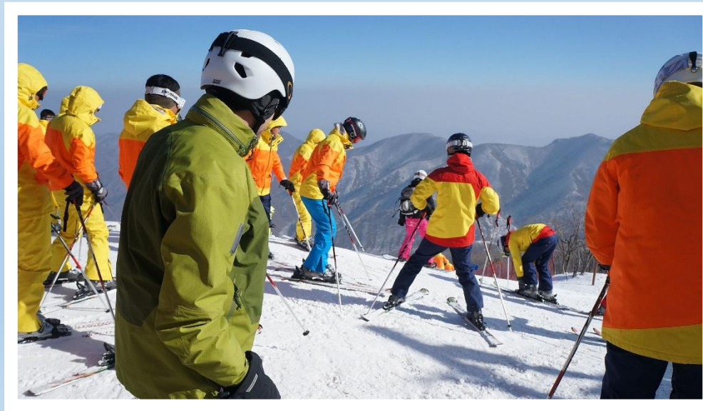
- Гірськолижний курорт біля міста Вонсан