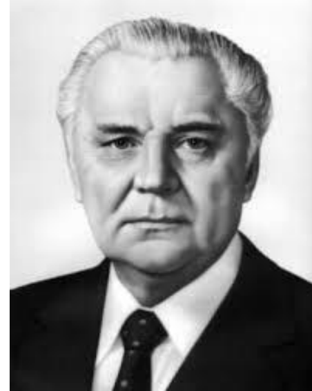
Володимир Щербицький 1972 – 1989 рр.

✓Що було спільного та відмінного в політиці П.Шелеста і В. Щербицького?