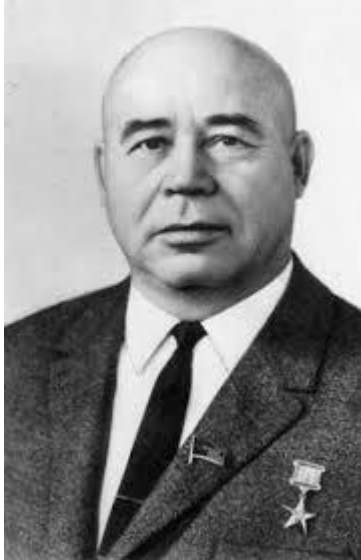
Петро Шелест 1963 – 1972 рр.